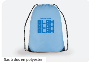
Sac à dos en polyester