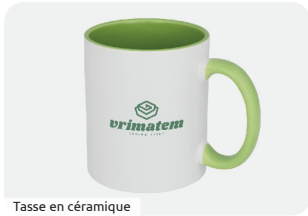
Tasse en céramique