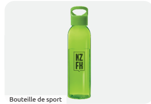
Bouteille de sport