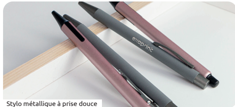
Stylo métallique à prise douce