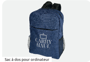
Sac à dos pour ordinateur