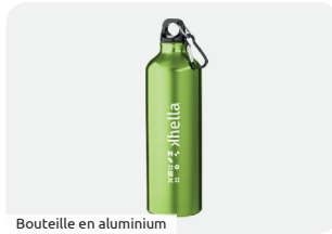
Bouteille en aluminium