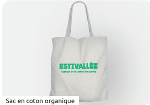
Sac en coton organique